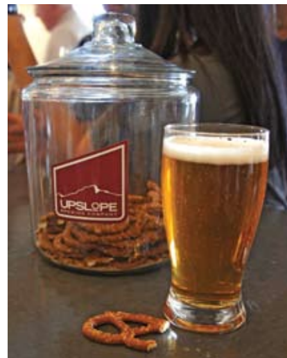
A la izquierda, unos chicos tocando en Pearl Street. Arriba, una cerveza del Upslope, cervecería artesanal.