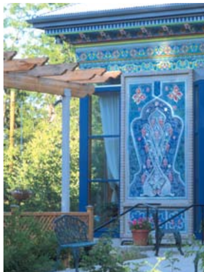
La tetería Dunshabe, en el centro de la ciudad, ofrece todo tipo de infusiones en un ambiente original.

Boulder. Con un trabajo de 40 artesanos , esta obra de arte tardó tres años en construirse. Hoy día es la casa del té favorita de los habitantes de la ciudad. Por fuera, el lugar está forrado de paneles de cerámica en las paredes, los cuales representan figuras islámicas. Las bancas y el mobiliario son artesanales, tallados a mano. La fuente principal, rodeada de esculturas, está basada en una leyenda de Tajikistán.